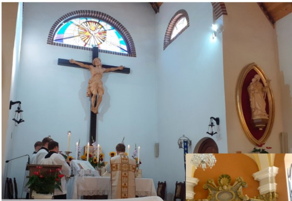
Fatima - Kapelle