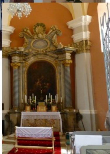
St. Anna -Kapelle