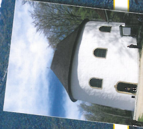
Schneekoppe und St. Anna-Kapelle

Das Institut verbindet die Pflege der katholischen Tradition mit einer der Zeit gemäßen Pastoral. Mit dieser Zielsetzung wurde es vom heiligen Stuhl am 26. Mai 2004 mit aktiver Unterstützung durch den damaligen Kardinal Josef Ratzinger, unserem heutigen emeritierten Papst Benedikt XVI., offiziell als Gesellschaft apostolischen Lebens päpstlichen Rechts anerkannt. www.institut-philipp-neri.de/institut