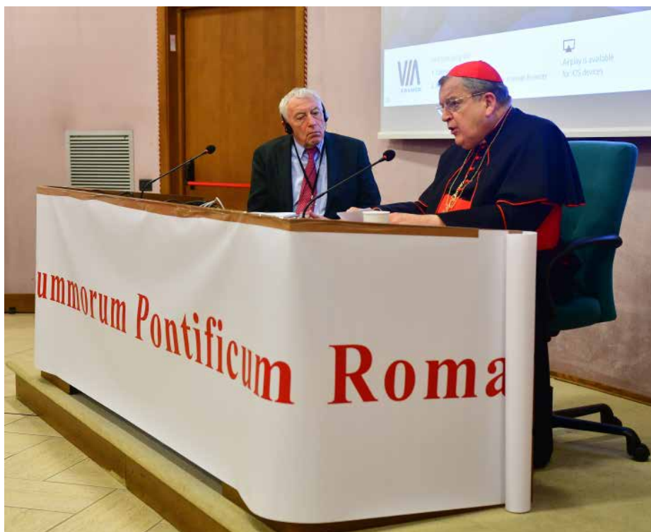
Raymond Leo Kardinal Burke beim Vortrag

Freilich ist es unter solchen Umständen notwendiger denn je, unserer Verpflichtung treu zu bleiben, all das zu fördern, was Papst Benedikt XVI. durch sein Motu Proprio zum Wohl der universalen Kirche beabsichtigte. Wir können uns nicht wie entmutigte und verängstigte Soldaten Christi verhalten, wir müssen vielmehr mutig sein und Vertrauen in die Wahrheiten haben, die Papst Benedikt XVI. durch sein gerade noch rechtzeitig veröffentlichtes Motu Proprio bewahren und fördern wollte. Als unser Herr seine Apostel aussandte, um die Gläubigen in