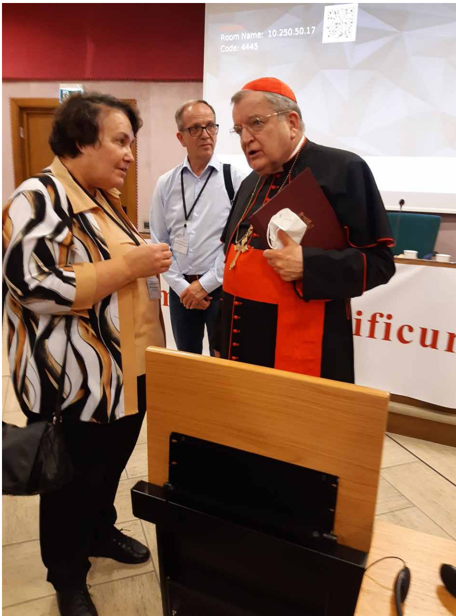
Kardinal Burke im Gespräch mit Monika Rheinschmitt

damit der Glaube unverseht weitergegeben wird; denn das Gesetz des Betens (lex orandi) der Kirche entspricht ihrem Gesetz des Glaubens (lex credendi). 8