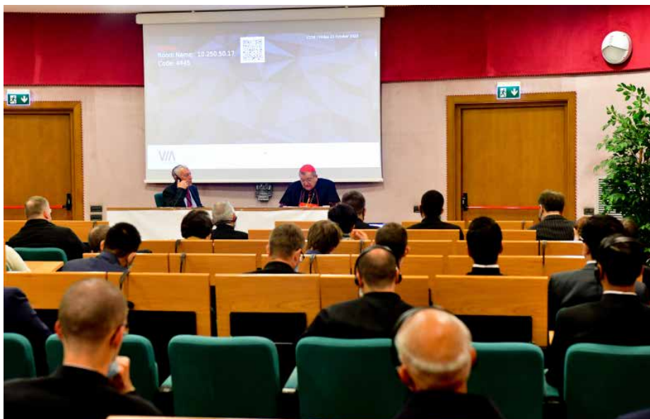
Vortragssaal im Institut Maria Santissima Bambina (Rom)

Wir müssen viel für die Mitarbeiter der Glaubenskongregation beten, welche die Zuständigkeiten inne haben, die früher der Päpstlichen Kommission Ecclesia Dei zukamen, sowie für die Oberen der Kongregation, die jetzt direkt an der Arbeit des betreffenden Büros beteiligt sind. Gleichzeitig müssen wir unser Bestes tun, um dieses Amt und damit seine Oberen über all das Gute zu informieren, mit dem die regelmäßige Feier der Sakramente und Sakramentalien nach dem usus antiquior der Kirche dient.