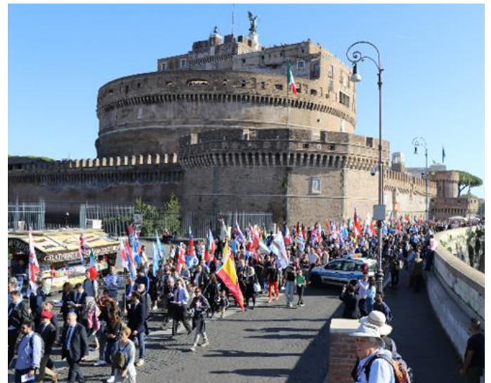
Romwallfahrt 2022 des Coetus Internationalis Summorum Pontificum