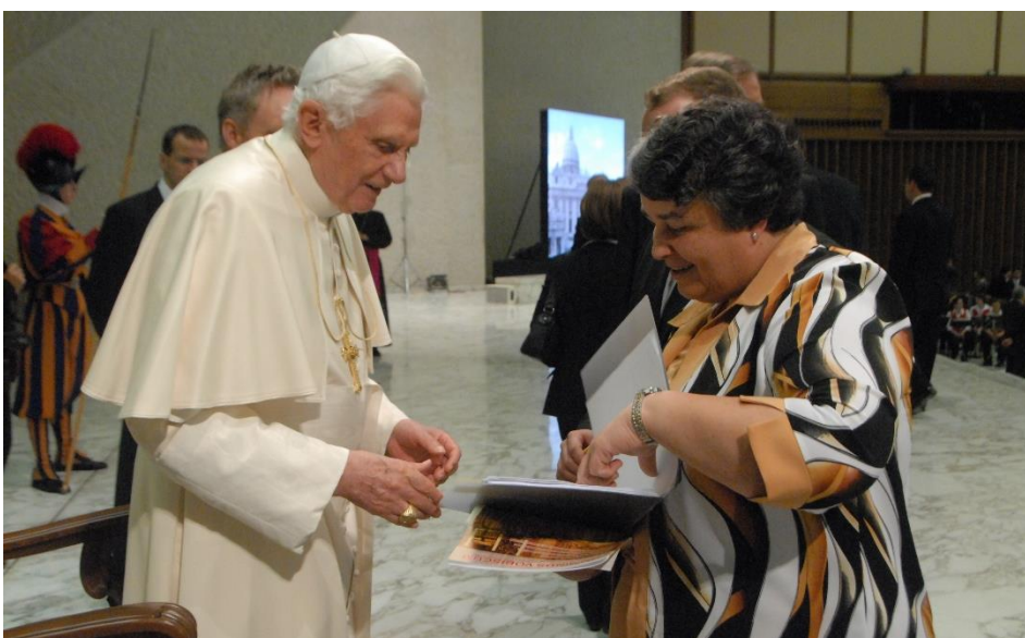
Rom, Generalaudienz im November 2010