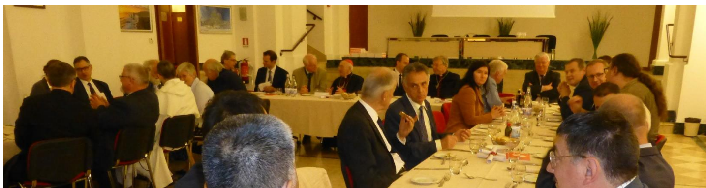
Abendessen mit den Delegierten der Internationalen Föderation Una Voce (FIUV) 2015 in Rom