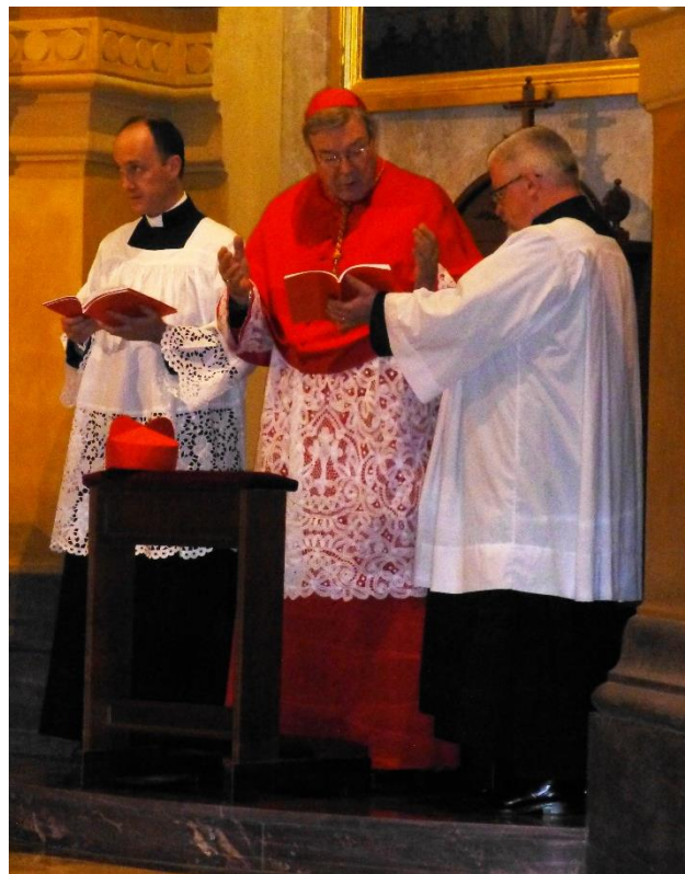
Vesper bei FIUV-Versammlung in Rom (2015)